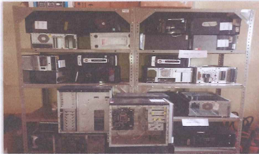
Fotografía muestra el estado actual de los bienes